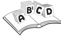
Tabela Ortográfica- Alfabetização TERMO 4 Semana 5